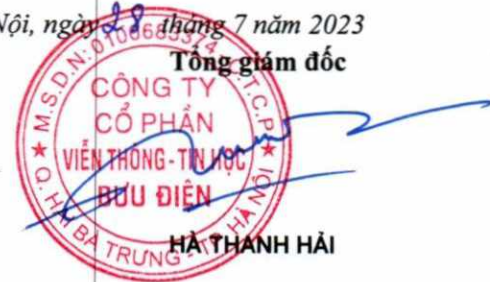
HÀ THÀNH HẢI